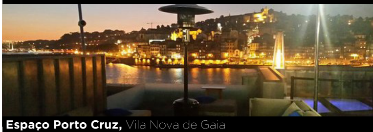
Espaço Porto Cruz, Vila Nova de Gaia

São poucos os portugueses que dedicam algum do seu tempo livre ao contacto com as nossas adegas e produtores de vinho. Contrariando a cultura europeia de proximidade, a demonstração do nosso interesse e carinho pelos vinhos portugueses ocorre, exclusivamente à mesa; em casa ou no restaurante. Já dediquei vários artigos às melhores propostas de enoturismo que podemos visitar em Portugal. Qualquer percurso de aquisição de conhecimentos deve passar pelos verdadeiros teatros de operações: a vinha e a adega. É aí que, através de visitas regulares e espaçadas, o leitor percebe os segredos e a alma do vinho. Todos os anos, a época do São Martinho representa uma oportunidade de contacto com a produção; de Norte a Sul, muitas casas agrícolas abrem as suas portas no fim-de-semana de 12 e 13 de Novembro. Talvez isso tenha contribuído para a nossa fama de hospitaleiros; a verdade é que, pouco a pouco, os produtores de vinho têm vindo a investir na dimensão complementar do enoturismo como forma de melhor acolherem os visitantes, ampliando a vertente educacional e a percepção clara da qualidade dos seus produtos; a venda "à porta da adega" representa mais de 40% do total das receitas, em países vinhateiros que apostam no enoturismo, como a Alemanha ou os Estados Unidos. Para uma fruição ampla e para um enraizamento profundo com a vinha e com o vinho, multiplicam-se os projectos de enoturismo, alguns com excelentes condições de estadia, e a eles dedico as nomeações desta semana.